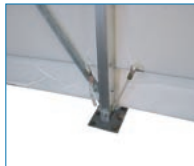
Sistema di tensionamento inferiore dei teli