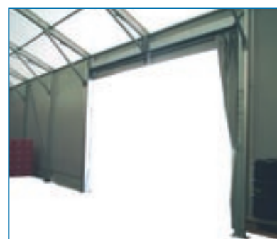
Tipologie di aperture possibili