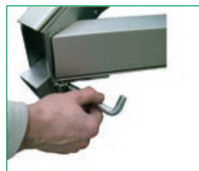
Dettaglio trave colonna.