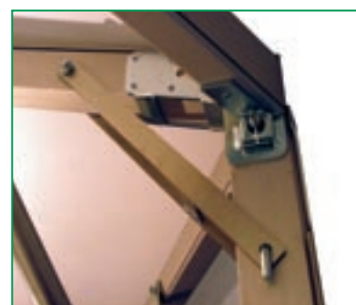
Dettaglio rinforzo angolare.