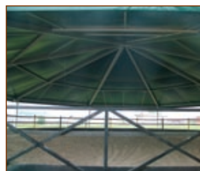
Forma ideale per la copertura dei tondini