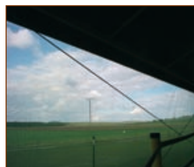
Teli laterali realizzati con lo speciale tessuto a rete.