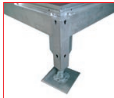
Colonna regolabile in altezza.

• Dimensioni modulari mt 3.0 x 2.0 o 3.0 x 3.0