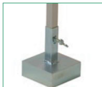
Piastra con contrappeso.