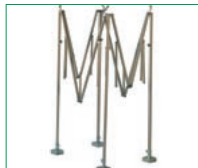
Apertura e chiusura a fisarmonica.

• Dimensione mt 2.5 x 2.0 3.0 x 2.0 3.0 x 2.5 3.5 x 2.5 4.0 x 2.5