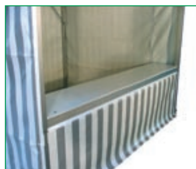
Il banco di vendita.