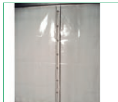
Chiusura dei teli laterali.